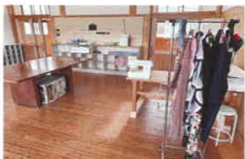
手芸や木工が可能なアップサイクルファブラボ、イベントなども定期的開催。