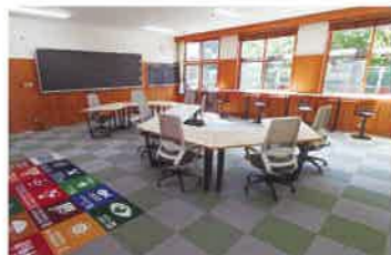
シェアオフィスの一例(サイレントルーム)。 Wi-Fiや北山丸太を使ったデスクを完備。