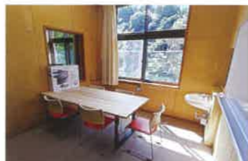
オフィス以外にも、共用で使えるミーティングルームを各階に完備。