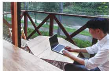
1階の各オフィスにはデスクスペースがあり、山や川を眺めながらの仕事も可能。